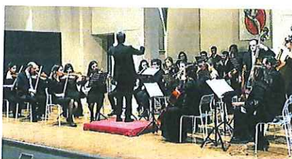
L'EVENTO L'Orchestra sinfonica giovedì a Pietrelcina per San Pio

Si arricchisce il programma dei festeggiamenti del 135° anniversario della nascita di Padre Pio. Giovedì 26 maggio nella chiesa conventuale «Sacra Famiglia» di Pietrelcina, su invito dei Frati Minori Cappuccini e di Comune e Pro loco, si esibirà l'Orchestra sinfonica del Conservatorio «Nicola Sala» di Benevento.