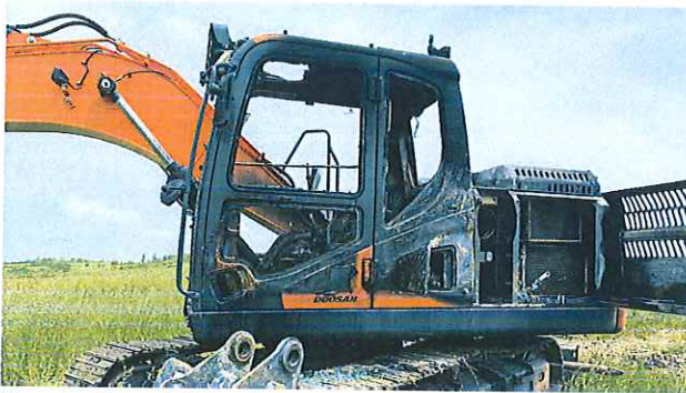
L'escavatore distrutto dalle fiamme a Casalduni

Casalduni Pochi dubbi sul dolo. Iacovella: «Vicini all'azienda»